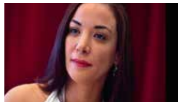
Loubna Abidar, en av många följda artister. Läs mer på baksidan.

En hatkampanj mot den marockanska skådespelerskan Loubna Abidar har fått henne att fly sitt hemland. Nyligen misshandlades hon av okända på en gata i Casablanca, själv säger hon att ansvaret ligger hos myndigheterna.