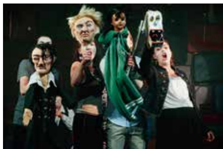
Scenkonst Sörmlands uppsättning av Romeo & Julia

Bara Frankrike har fått mer. Dessutom har nio projekt inom animation, dokumentär och fiktion beviljats utvecklingsstöd i den senaste omgången. Därmed placerar sig Sverige högst upp på listan både vad gäller antalet projekt och mängden stödpengar.