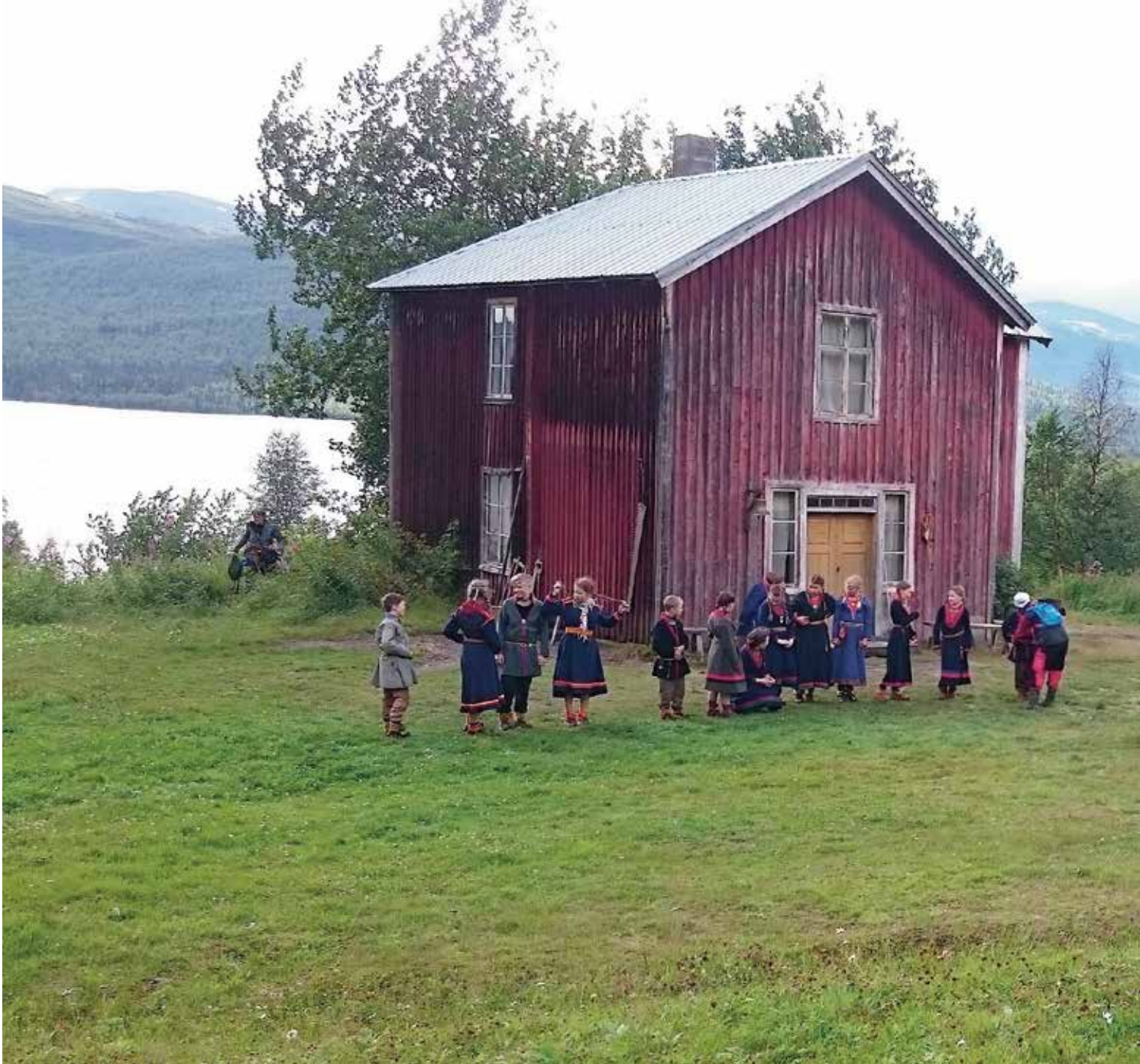
Bild från inspelningen av Sameblod.