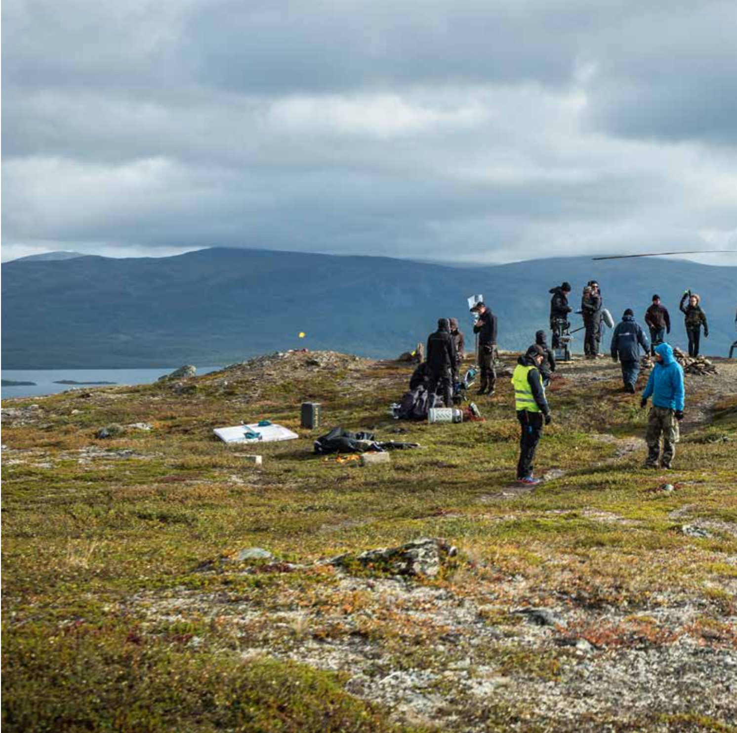
Bild från inspelningen av filmen Midnattssol.

säger han. Att fasiken vad smidigt det är att filma i Norrbotten.