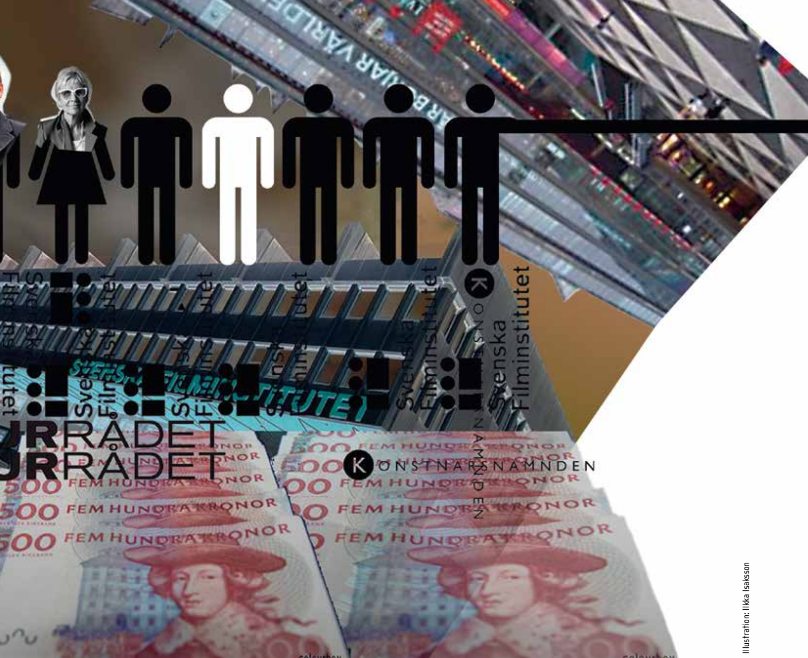
Illustration: Ilkka Isaksson

– Tidigare gav vi förslag på representanter för konstarna, och fick gehör för våra förslag. Men det har blivit allt svårare att komma till tals som kulturskapare, kanske uppfattas det som krångligt om utövarna får stort utrymme med sina synpunkter.