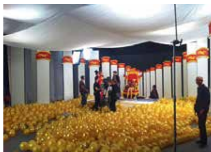
Inspelningen av Krakel Spektakel

På Teaterförbundets hemsida hittar du uppdaterad information om aktuella frågor, som till exempel avtalsförhandlingar, nya förmåner, yrkesträffar och utbildningar. Via hemsidan kan du även läsa de nyhetsartiklar där Teaterförbundet omnämns i press och media.