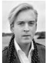
Skådespelare, avgångsstudent på Stockholms Dramatiska högskola och verksam som skribent.