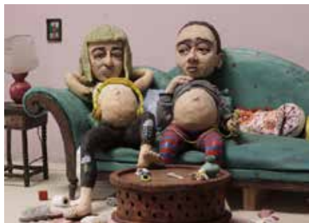
Ur Moms on fire, av Johanna Rytel.

Av de 150 ansökningarna har fem nu tagits ut för produktion. Premiärvisning blir det till hösten. Titlarna är: Drip Drop, Paralys, Inkräktarna, Oh Deer och @janabringlove.