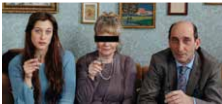
Den Guldbaggebelönade filmen Min faster i Sarajevo gjordes inom ramen för satsningen Moving Sweden.

Operasångaren Malena Ernman har valts in i Kulturrådets styrelse. Uppdraget sträcker sig fram till den 31 december 2019, skriver kulturdepartementet i ett pressmeddelande.