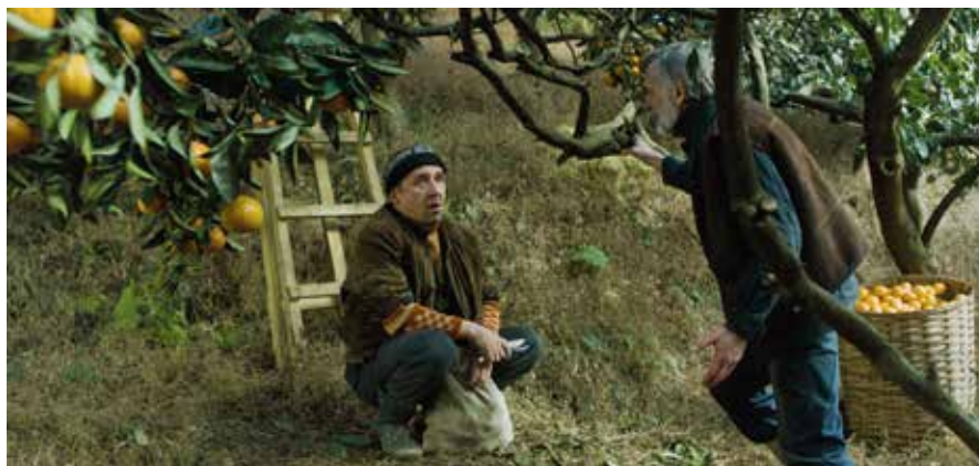
Bild ur filmen Mandarinodlaren .

Botgöringen (Repentance) (1984) Regi: Tengiz Abuladze. Regissörens kritik av stalinismen förbjöds i Sovjetunionen, och vann Grand Prix i Cannes.