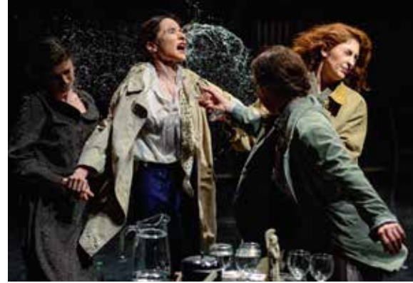
Ur föreställningen Trojanskorna i regi av Data Tavadze.

Sverige har haft ett intensivt samarbete med teatern i Georgien i form av gästspel och utbyten.